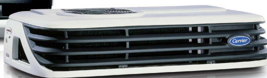
Xarios 300 / 350 / 350MT