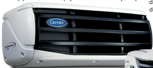
Xarios 500 / 600 / 600MT

Agregaty XARIOS charakteryzują się niskim poziomem hałasu, co ogranicza ich oddziaływanie na środowisko i poprawia komfort pracy kierowcy. Kabinowy panel sterowania jest łatwy w obsłudze i umożliwia wybór trybu pracy z napędem tylko od silnika pojazdu lub z napędem od silnika pojazdu i z sieci elektrycznej. Obudowy skraplaczy i parowników agregatów nadają się całkowicie do powtórzonego przetworzenia.