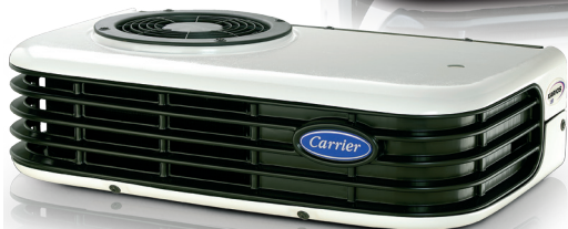
Xarios 150 / 200